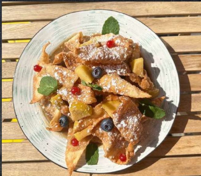
ЛЕНИВЫЙ ШТРУДЕЛЬ В ЯБЛОЧНОМ СОУСЕ 450₺

СОВЕТСКОЕ МОРОЖЕНОЕ 250 ₺ ХВОРОСТ 250 ₺ ДЕСЕРТЫ в ассортименте 590 ₺