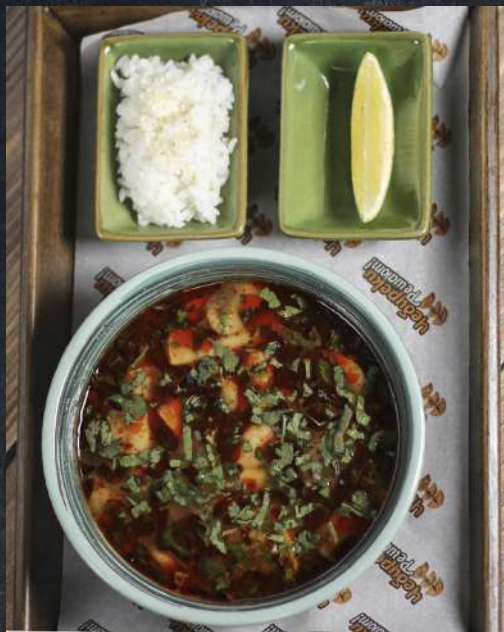
ТОМ-ЯМ по авторскому рецепту