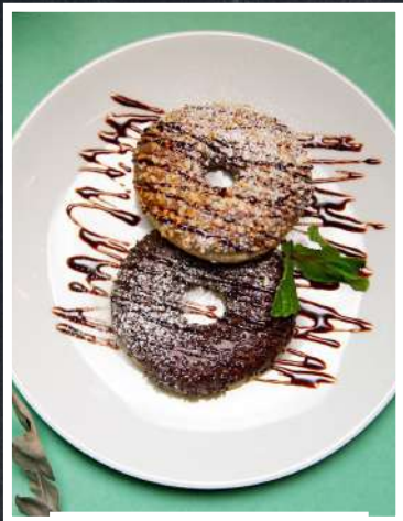
ДОНАТСЫ 350 ₺

СОВЕТСКОЕ МОРОЖЕНОЕ 250 ₺ ХВОРОСТ 250 ₺ ДЕСЕРТЫ в ассортименте 590 ₺